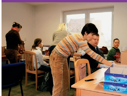
CHRÁNENÉ DIELNE POSKYTUJÚ PRÁCU ZDRAVOTNE POSTIHNUTÝM

spôsob získania lacnej pracovnej sily (štrát na každé takto vytvorené pracovné miesto poskytujú finančný príspevok), našli sa ale aj takí, ktorí radi podali pomocnú ruku znevýhodneným spoluobčanom a pustili sa do toho s nadšením. Ale nech už bol prvotný zámer akýkoľvek, nešlo rozhodne o prechádzku ružovým sadom a mnohí, aj napriek úprimnej snahe, museli svoju chránenú dielňu po niekoľkých rokoch zrušiť. Jej prevádzkovanie totiž naozaj vôbec nie