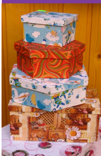
Z PRODUKcie SLOVENSKEJ CHRÁNENEJ DIELNE

A v tom sme iní. SLOVENSKÁ CHRÁNENÁ DIELŇA totiž združuje ľudí so zníženou pracovnou schopnosťou z mnohých kútov Slovenska.